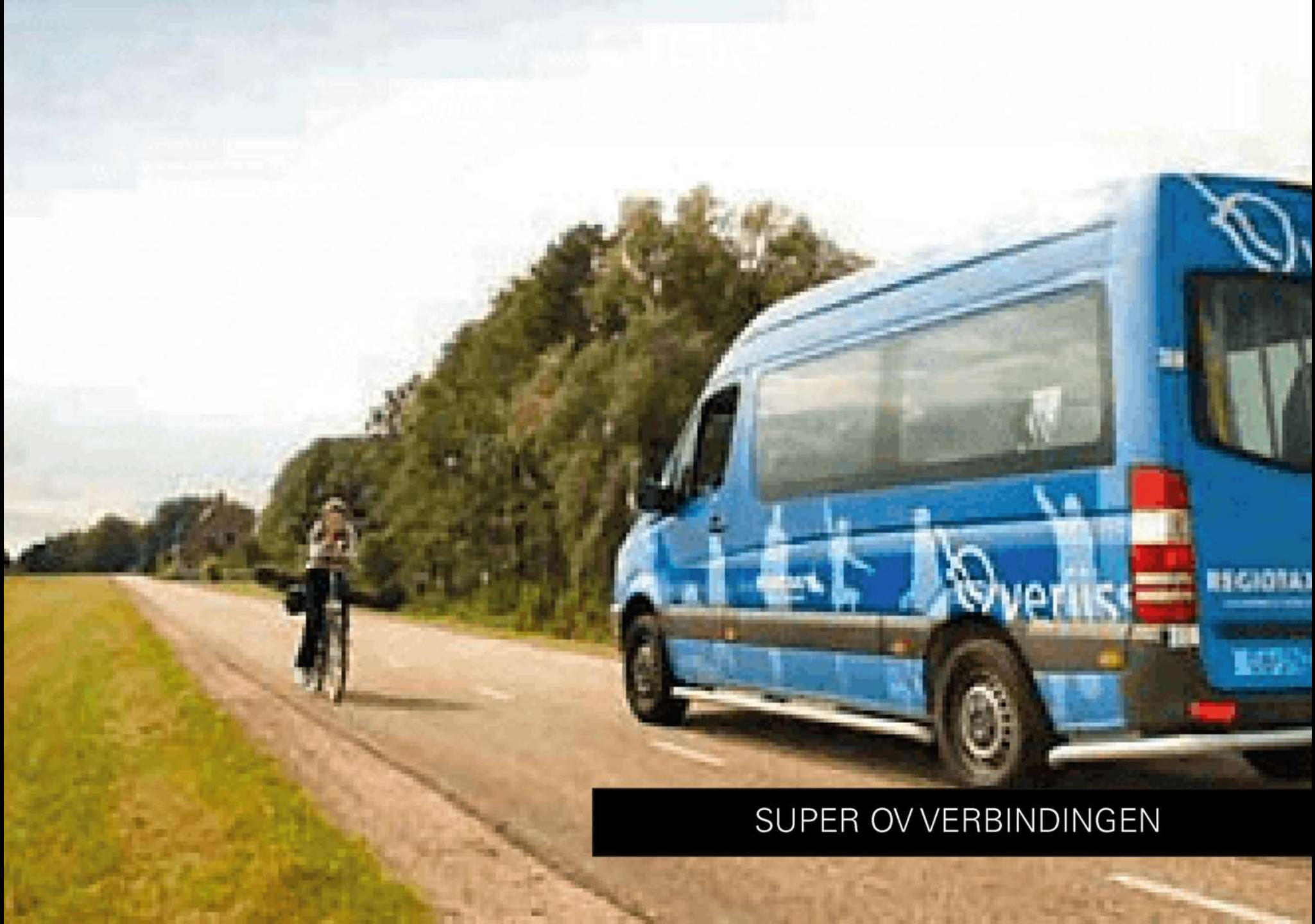
SUPER OV VERBINDINGEN